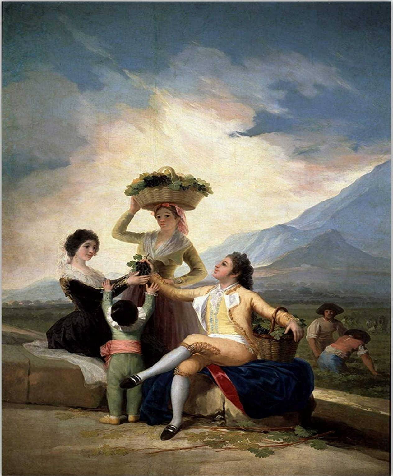
La Vendemmia Francisco Goya 1786-1787