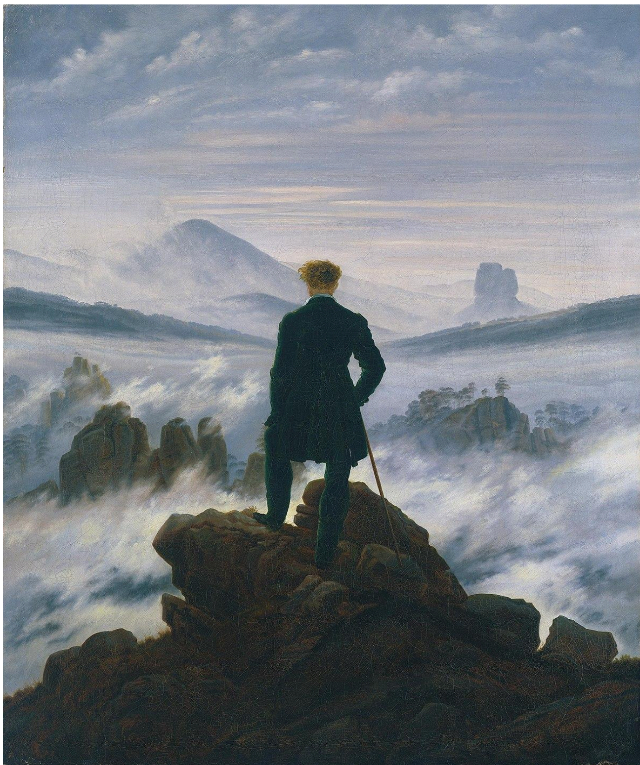
Casper David Friedrich Viandante sul mare di nebbia 1818