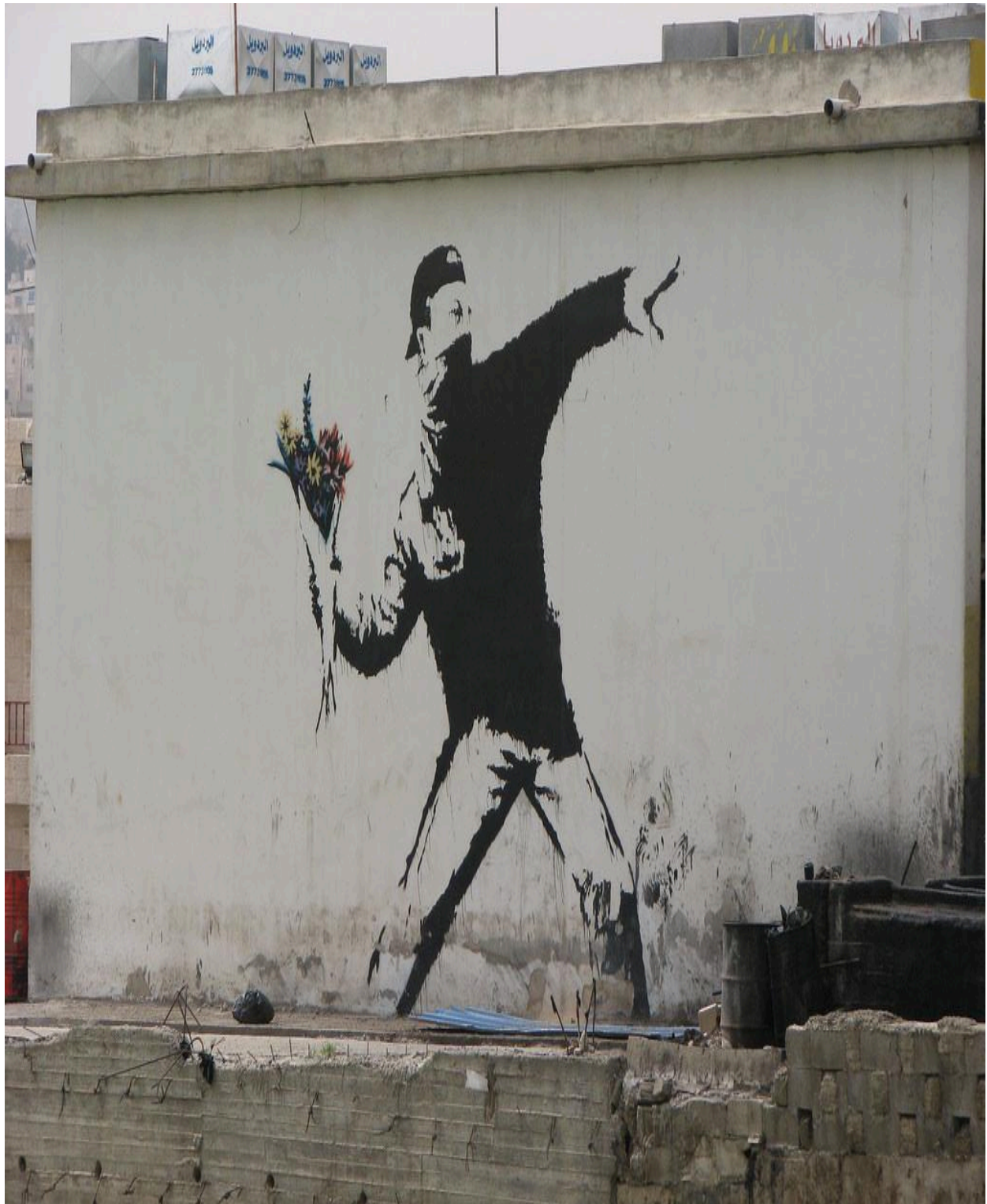
Lanciatore di Fiori Banksy Gerusalemme 2005