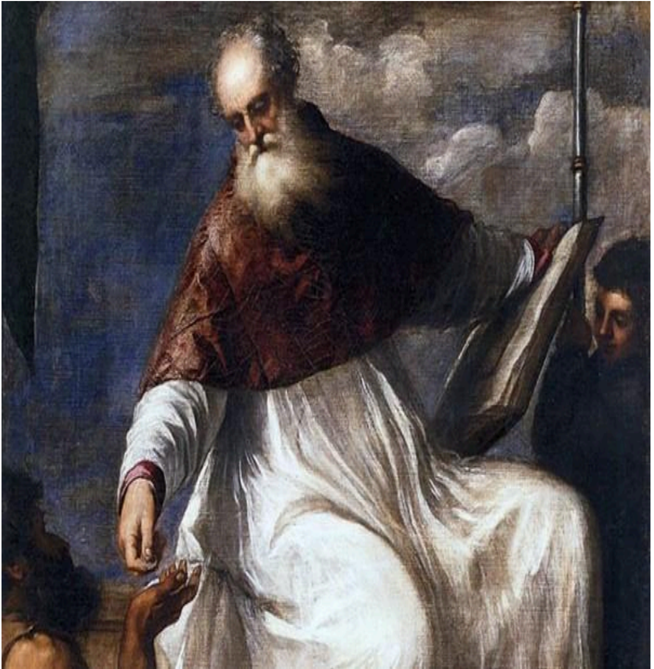
Tiziano Vecellio San Giovanni Elemosinario 1545