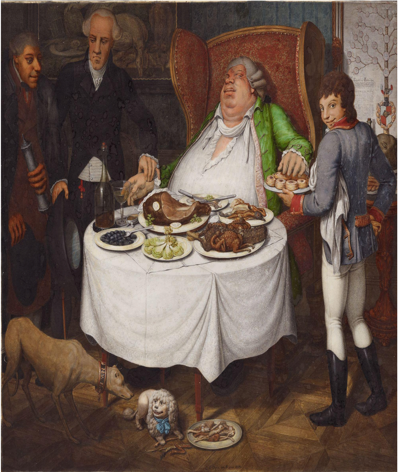
Der Völler Georg Emanuel Opiz 1804